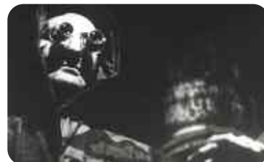
La Jetée, Chris Marker