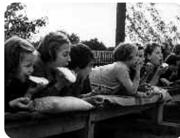
Le Dernier des injustes, Claude Lanzmann