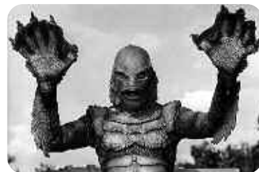
L'Étrange créature du lac noir, Jack Arnold

Projection avec mise à disposition de lunettes actives 3D. L'entrée est majorée de 1 euro pour leur location. Attention : les lunettes 3D que vous pouvez posséder sont dites « passives » et ne fonctionneront pas !