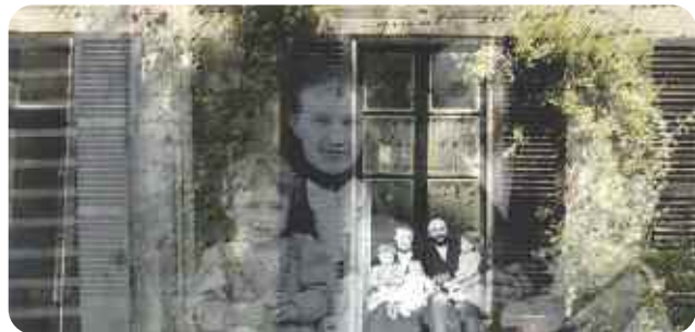
La Cicatrice, une famille dans la Grande Guerre, Laurent Véray