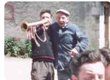
Ciclic, Jean Chaudron, 1966, Carte blanche à Laurent Mabed