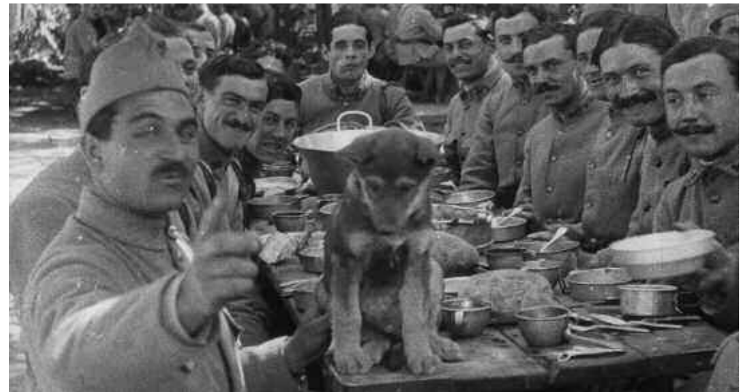
Châteauroux, les fêtes du retour des poilus, 24 août 1919

Bénédicte Dominé, directrice du cinéma l'Apollo