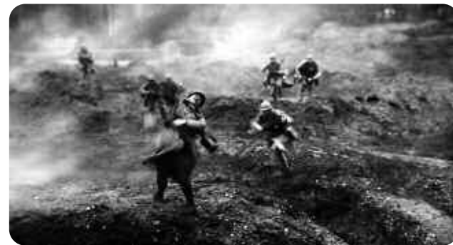
Verdun, visions d'Histoire, Léon Poirier

Verdun, visions d'Histoire est à la fois un film-monument et un film-mémorial. Léon Poirier y consacre onze mois de tournage sur le site même de la bataille, convoque les troupes de l'armée française, fait appel à l'État-Major et surtout reconstitue minutieusement le déroulement de la bataille (jusqu'à la topographie du fort de Vaux). Ses contemporains, pour la plupart anciens combattants, témoins de la guerre à des titres divers, y ont vu une représentation enfin réaliste de l'enfer de la guerre, où l'on n'hésite pas à montrer la souffrance des poilus comme des civils. L'œuvre de Léon Poirier est donc également un témoignage essentiel – parce qu'elle est racontée par des survivants – sur une guerre qui a traumatisé la société française. Le film-monument s'efface alors derrière le Lieu de mémoire, et ce n'est pas le moindre mérite de ce film que de donner à voir ce glissement.