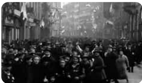
L'Héroïque cinématographe, Laurent Véray et Agnès de Sacy