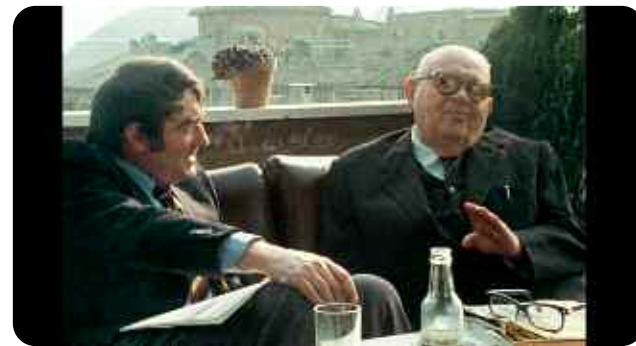
Le Dernier des injustes, Claude Lanzmann