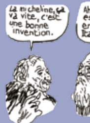
Edmond Baudoin, Les Enfants de Sit